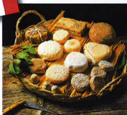
Für Frankreich-Fans mit dem Reisemobil ist das Angebot von France Passion überaus attraktiv.