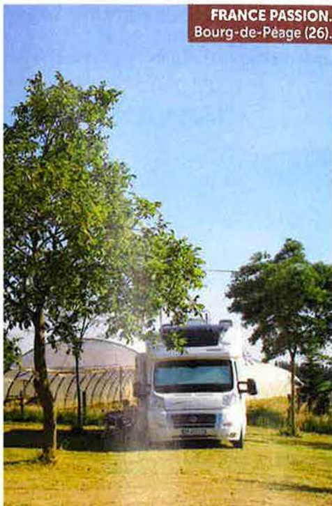
FRANCE PASSION. Bourg-de-Péage (26).