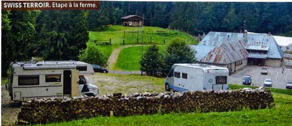
SWISS TERROIR. Etape à la ferme.