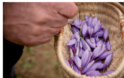
Un producteur de safran bio en Dordogne