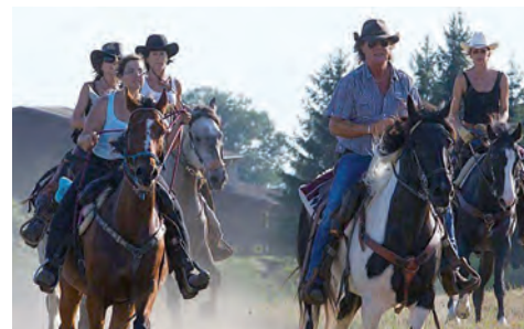
Des cow-boys dans le Jura