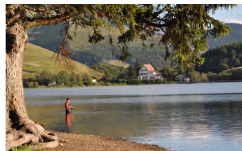
Un pêcheur en Haute-Provence

En 2021, découvrez 200 nouvelles étapes et profitez de 10 000 emplacements pour la nuit , toujours gratuits et en toute sécurité !