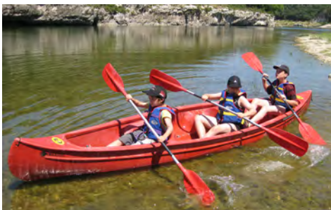
Une descente de l'Ardèche en canoë