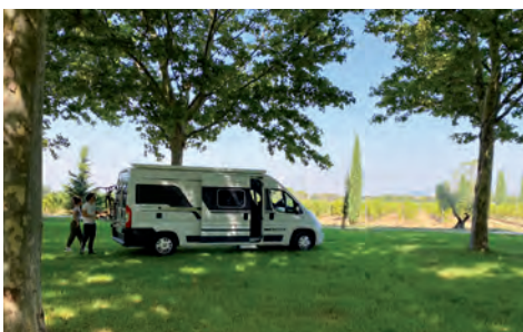
Au milieu des vignes au pied du Ventoux